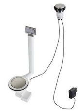
Vidange automatique Space Light - PL 8407 117