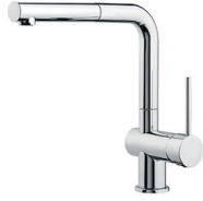
Mitigeur Gamma 8483 001