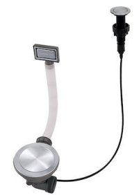
Vidange automatique Space Push - PP 8407 116